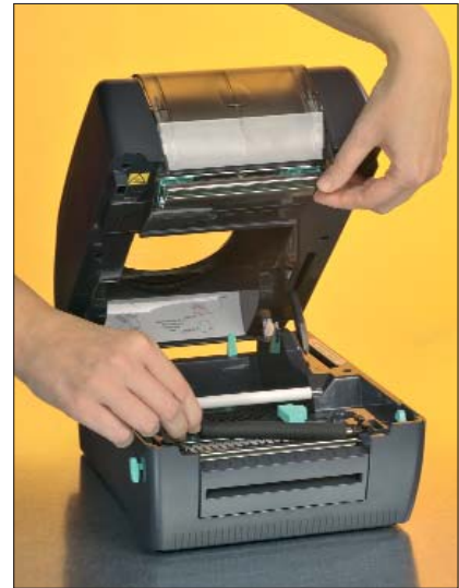
Druckkopf und Druckwalze können einfach ohne Werkzeugeinsatz ausgetauscht werden.

Der langlebige, hochqualitative Druckkopf verfügt über eine Laufleistung von 25 km und kann ohne Werkzeugeinsatz per Hand ausgetauscht werden.