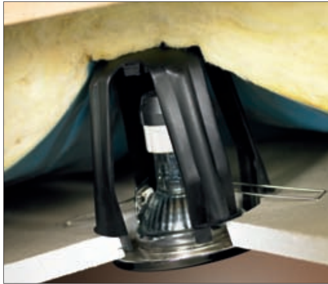
SpotClip gewährleistet einen sicheren Abstand – wo auch immer Dampfsperffolien oder Dämmwolle montiert werden.