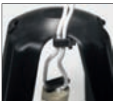
Kabelaufnahmen am Hitzeschutzdach fixieren die Zuleitung der Leuchte.

Alle Maße in mm. Technische Änderungen vorbehalten.