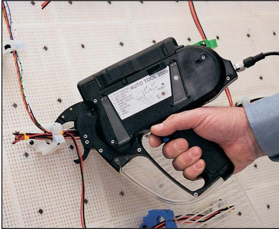
Manuelles Fertigen eines Kabelbaums mit dem AT2000.

einem Kabelbinder rechts und links auf dem Balken verschiebesicher am Bündelgut befestigt.