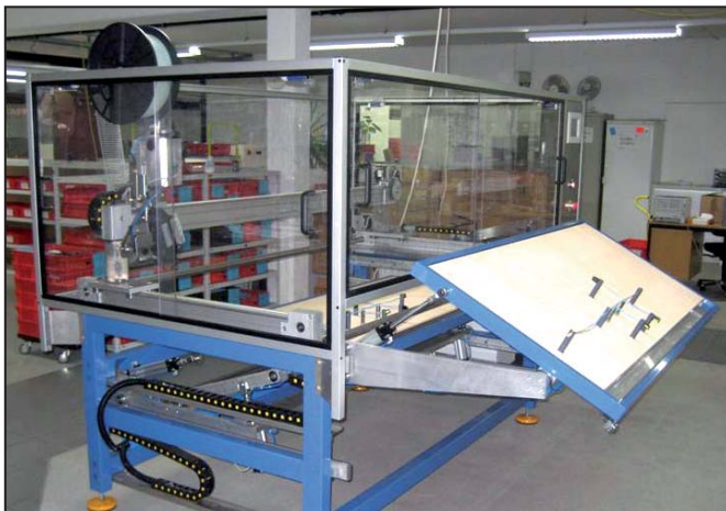
Wechseltisch bestehend aus einem Tischaufbau und dem automatischen Abbinde-System.

Die Fresenius Medical Care entschied sich für die Anlage eines italienischen Sondermaschinenbauers, der bereits seit einigen Jahren sogenannte Wechseltische für italienische Konfektionäre baut. Die Wechseltische für die Kabelkonfektion bestehen aus einem Tischaufbau mit einem freiprogrammierbaren automatischen Abbinde-System. Die Kabellegebretter sind übereinander angeordnet. Sie werden im Wechsel mit einem Kabelbaum belegt, während das zweite Brett automatisch abgebunden wird. Dann wird der abgebundene Kabelbaum heraus- und der neu gelegte zum Abbinden hineingefahren. Somit kann die Zeit des Bündelns komplett eingespart werden.