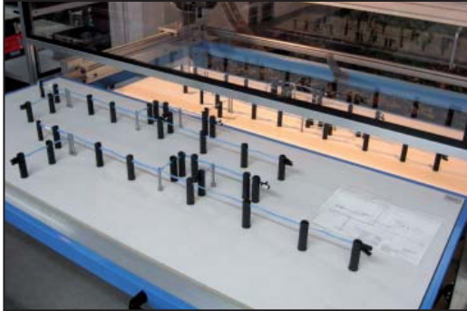
Kabellegeboard mit einem Fresenius Kabelsatz.

Gerechnet auf den kompletten Kabelbaum dauert eine Abbindung inklusive Verfahrenweg im Durchschnitt 2 Sekunden. Bei Fresenius werden viele verschiedene, jedoch meist kleine Kabelbaum-Typen hergestellt. Um die Legebretter dennoch effizient auszunutzen, werden häufig zwei Kabelbäume nebeneinander auf einem Brett gefertigt.