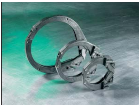
Drei Zangengrößen optimieren den Abbindezyklus für die verschiedenen Bündeldurchmesser.

So vereinfacht sich die Endmontage der Kabelbäume, da der vorkonfektionierte Kabelbaum an einer Kante oder Bohrung fixiert werden kann. Die Einstellung der Bandspannung erfolgt an die Anwendung individuell angepasst.