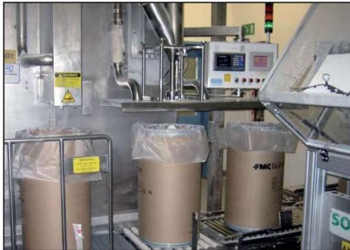
Zum Befüllen der Säcke kommt bei FMC eine von Somex entwickelte Anlage zum Einsatz.

Das Ziel des irischen Sondermaschinenbauers Somex Automation ( www.somexautomation.com ) ist die Entwicklung von intelligenten Lösungen zur Automation. Der Einsatz der Somex-Anlagen ermöglicht den vorrangig aus der Getränkeindustrie stammenden Kunden eine effiziente Produktion bei gleichzeitig hoher Produktqualität.