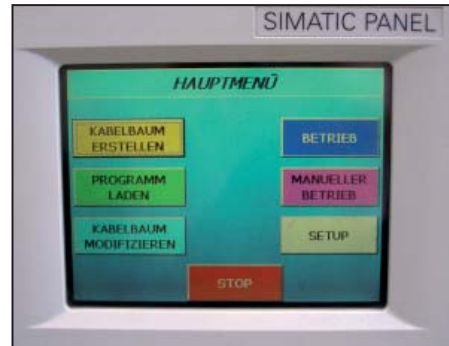
Einfache Bedienbarkeit der Anlage.

Durch die Umstellung des manuellen Fertigungsprozesses auf dieses Handlingsystem konnten alle zuvor definierten Ziele erreicht werden. Die Durchlaufzeiten können bei einer gleichbleibenden Fehlerquote um 0,7 Min/Kabelbaum reduziert werden. Dadurch wurde im Fall Fresenius eine deutliche Herstellkostenreduzierung von circa 20% möglich. Zusätzlich konnte Fresenius Medical Care durch die Automatisierung die Sicherheit und den Arbeitskomfort für das Bedienpersonal deutlich erhöhen. Die Höhenverstellbarkeit der Tische, eine schräge Montagebrettausrichtung und eine geräuscharme Kulisse sorgen heute für mehr Ergonomie am Arbeitsplatz.