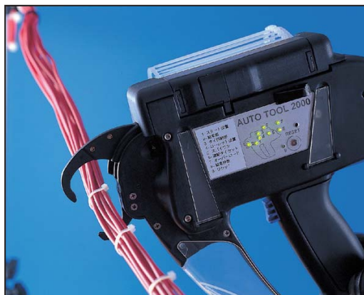
AT2000 mit Aufhängevorrichtung für die mobile Anwendung. Sekundenschnelles Anbringen der Kabelbinder.

Mit dem Bündelwerkzeug Autotool 2000 können Kabelbinder mit einer Zykluszeit von 0,8 Sekunden umschlaucht, gespannt und bündig abgeschnitten werden. Der maximale Bündeldurchmesser liegt bei 20 mm. Das AT2000 verfügt über eine individuell einstellbare Abbindekraft und kann sowohl Bandketten mit 50 Kabelbindern als auch Bandspulen mit einer Kapazität von 3500 Stück verarbeiten. Außerdem können Befestigungselemente „Bundling Clips“ vollautomatisch angebracht werden. Die Clips werden zeitsparend mit