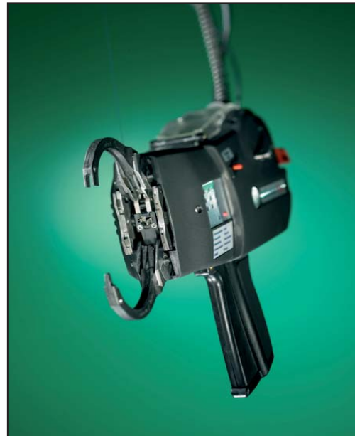
Autotool System 3080.

Das Autotool System 3080 ist die richtige Entscheidung für viel Flexibilität bei der Anwendung. Zu diesem System gibt es auf dem Markt keine Alternative. Erhältlich mit schnell austauschbaren Abbindeezangen von 30, 50 und 80 mm können Durchmesser von 1 mm bis 80 mm vollautomatisch gebündelt werden. Die Bündelgeschwindigkeit liegt je nach Bündeldurchmesser zwischen 0,8 und 1,6 Sekunden pro Zyklus. Ein zweiteiliges Verschlussystem, bestehend aus einem außenverzahnten Endlosband und separaten Verschlussköpfen, ermöglicht komplett abfallfreie Abbindungen. Zusätzlich kann das ATS3080 eine große Anzahl an Befestigungselementen vollautomatisch anbinden.