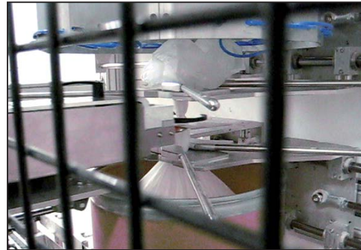
Das AT33080 in der horizontalen Anwendung.

Die Plastiksäcke werden in Großgebinden auf einem Fließband von Station zu Station gefahren. Nach dem Befüllen der Säcke wird das Gebinde zur Verschluss-Station weiter transportiert. Dort wird das Plastik am oberen Ende des Sackes mittels zweier V-artiger Schieber auf einen Durchmesser von ca. 50 mm gerafft. Da der gesamte Prozess in einem explosionsgefährdeten Bereich stattfindet, wurde das fest in die vollautomatische Anlage integrierte AT33080 gekapselt, um das System vor der hohen Feinstaubbelastung zu schützen. Durch das Startsignal der Anlage zum Abbinden ausgelöst, fährt die horizontale Vorrichtung mit dem AT33080 an den Plastiksack heran und verschließt diesen vollautomatisch in ca. 1,3 Sekunden mit einem Kabelbinder. Der Kabelbinder besteht im Gegensatz zu der handelsüblichen Variante aus einem endlosen Band und separaten Verschlussköpfen, sodass bei der Abbindung kein Abfall zurückbleibt.