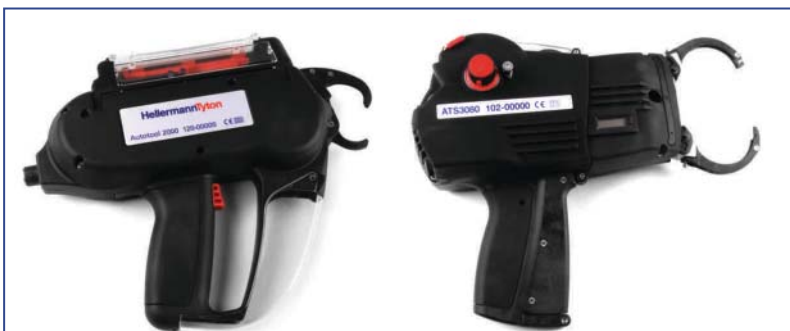
Die automatischen Bündelsysteme AT2000 und ATS3080.

HellermannTyton, ein Marktführer im Bereich der automatisierten Kabelkonfektion, entwickelte und optimierte in enger Zusammenarbeit mit Industriekunden die automatischen Bündelsysteme Autotool 2000 (AT2000) und Autotool System 3080 (ATS3080), die heute in vielen Industriezweigen zum Einsatz kommen.